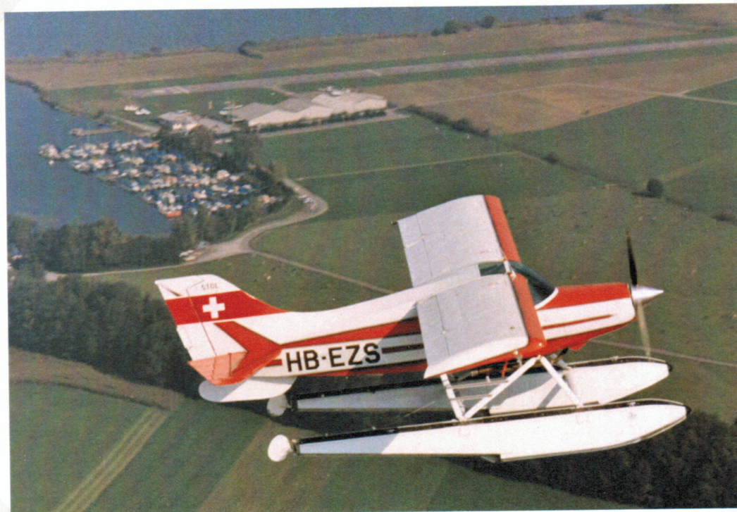
Wasserflugzeug über den Flugplatz Wangen – Lachen.