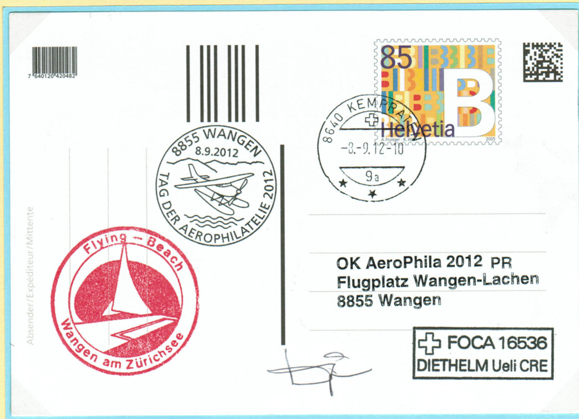
Probemuster Karte mit Flugplatzstempel und Unterschrift vom Piloten Ueli Diethelm.

AeroPhila 2012 08.09.2012 Flugplatz Wangen – Lachen.