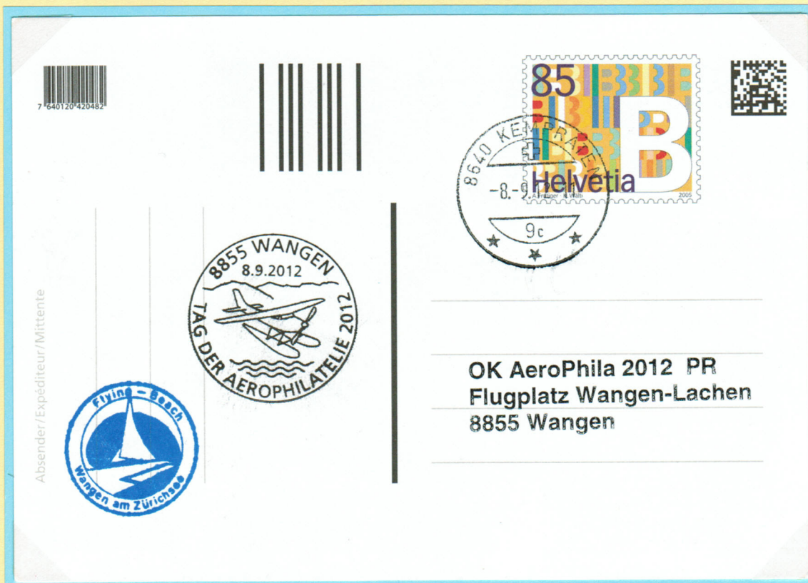
Probemuster Karte und Flugplatzstempel.

AeroPhila 2012 08.09.2012 Flugplatz Wangen – Lachen.