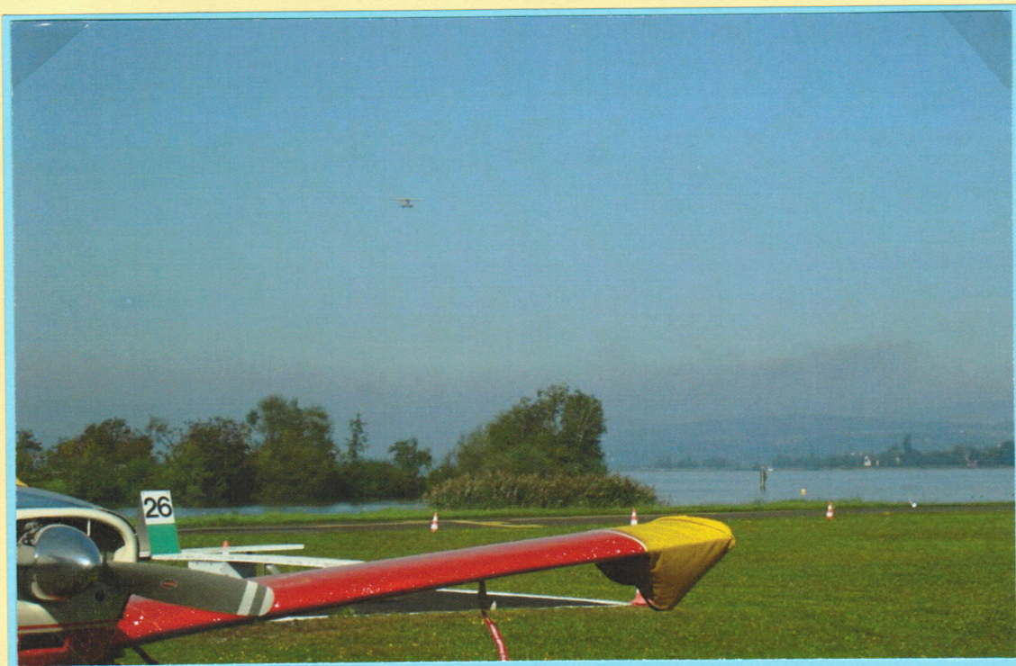
Wasserflugzeug im Anflug auf den Flugplatz Wangen - Lachen.