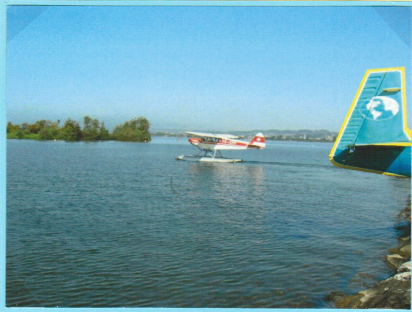
Ankunft des Wasserflugzeugs.

AeroPhila 2012 08.09.2012 Flugplatz Wangen – Lachen.