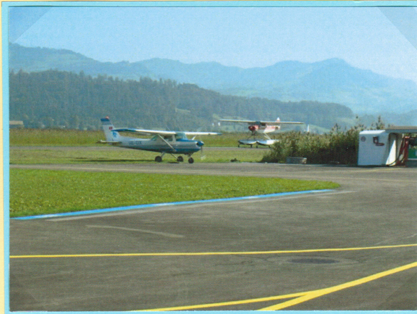
Landung des Wasserflugzeugs auf der Piste.

AeroPhila 2012 08.09.2012 Flugplatz Wangen – Lachen.