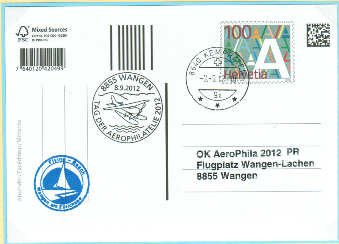
Probemuster Karte und Flugplatzstempel.

AeroPhila 2012 08.09.2012 Flugplatz Wangen – Lachen.