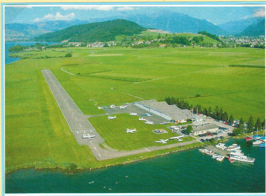
Der Flugplatz Wangen – Lachen auf dem Gebiet der Franzrüti am Obersee. Im Hintergrund das Dörfchen Nuolen mit dem Buchberg.