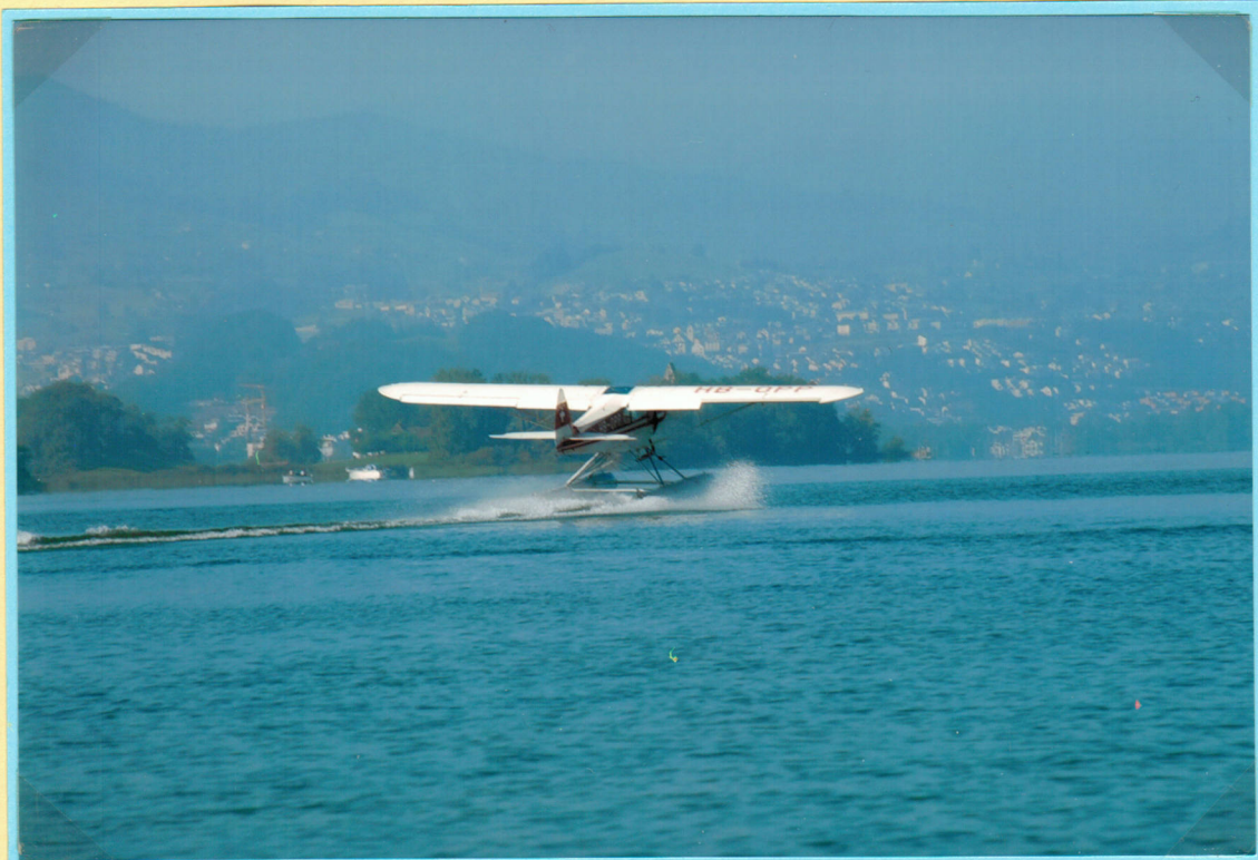
Start des Wasserflugbootes mit den Postsack in der Bucht von Kempraten.